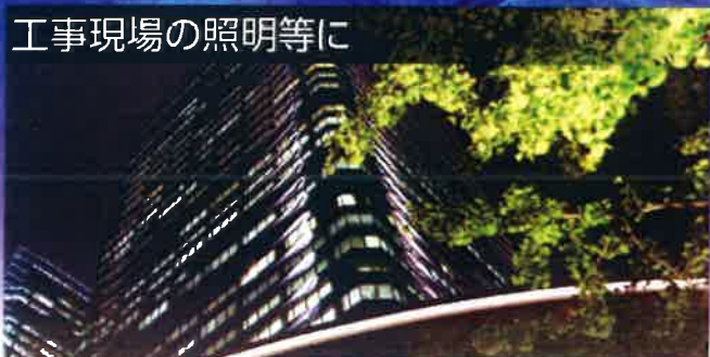
工事現場の照明等に